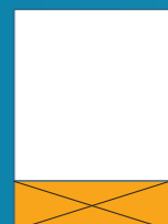
Faldón 60 x 210 mm Color