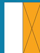
Media vertical 297 x 105 mm Color