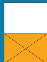
Media horizontal 148,5 x 210 mm Color